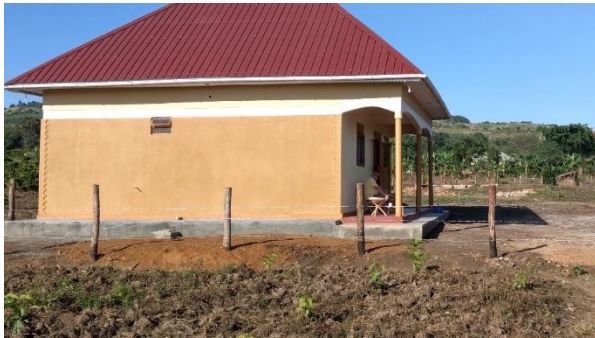
Foto: Gelände der im Aufbau befindlichen Landw. Haushaltschule Buliakamu