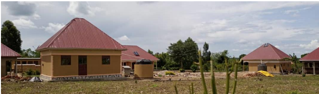
Ansicht der der jetzigen Schulanlage: ganz links: Lehrer Küche, hinten Toiletten, vorne Lehrerhaus, hinten Mitte Teilansicht Schulhaus. Rechts: Gästehaus und Teilansicht der neuen Schulküche. Nicht sichtbar im Hintergrund die Wasserpumpe.