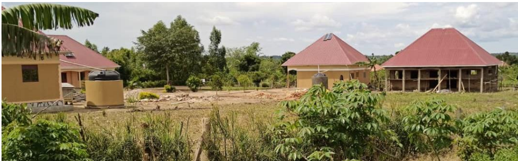
Rechts im Bild: Rohbau der Schulküche. Mai 2021

Stand Aufbau Landwirtschaftliche Schule: seit 2018 bis August 21